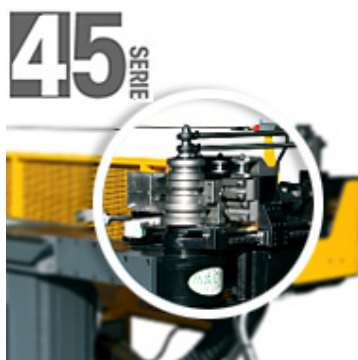
Curvadora de tubo Serie 45: